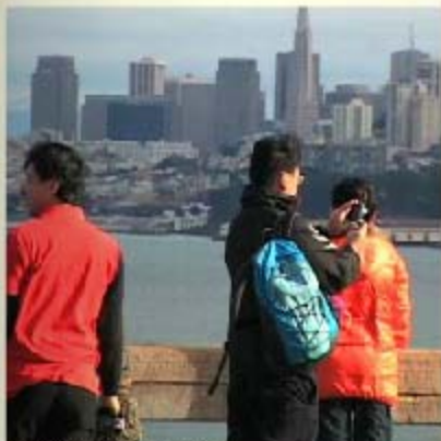
中国游客访问美国旧金山

近些年来，中国境外游客无论在数量和消费水准方面都显著提高，为世界各地的旅游经济注入活力。美国最近也宣布要精简中国公民的旅游签证申请，吸引更多中国游客来美消费，以此提振美国的经济。