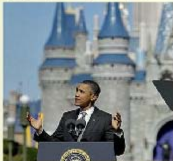
1月19号，美国总统奥巴马在佛罗里达州迪斯尼世界讲话

旅游业增长有助于创造就业，2010年近6千万外国游客到美国旅游。美国有120万人从事国际旅游业。