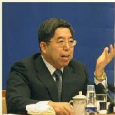
中国国家统计局局长马建堂

农历新年将至，出门采购的民众对高物价怨声载道，特别是蔬菜价格，有的已经高过水果价格，令低收入者望而却步。官方公布的物价上涨指数，跟民众的感受，产生了差距。