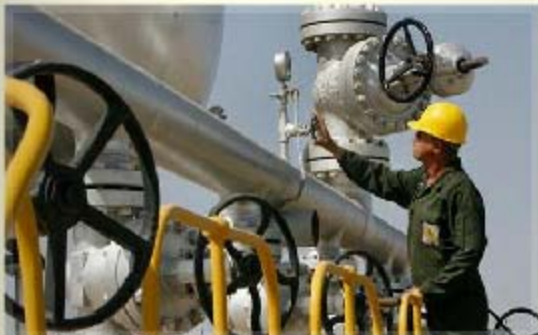
一名伊朗技术员在检查石油设施

中国星期三没有对美国财政部长盖特纳提出的减少从伊朗进口石油的要求做出具体的承诺。有分析认为，这是中国在不损害自己利益的同时与美国合作的一个良好机会，而且中国可能成为美国和欧洲对伊朗进行石油制裁的最大获益方。