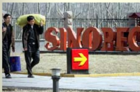
中国最大的炼油和石化产品生产商中石化在北京的一个加油站(资料照片)

就在美国国务院宣布制裁中国一家和伊朗有石油业务往来的公司的第二天，这家中国公司回应说，美方的指控是“无中生有”。