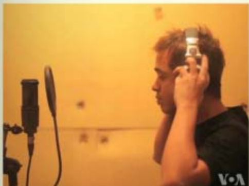
缅甸摇滚团体“副作用”的一位歌唱演员在录音

尽管许多国家欢迎缅甸进行中的政治改革，美国仍继续对缅甸实施经济制裁。这些经济制裁措施的目的是削弱缅甸政府的经济实力，但也会直接影响到一般缅甸人民。一群仰光音乐家发现，他们也受到经济制裁的影响。