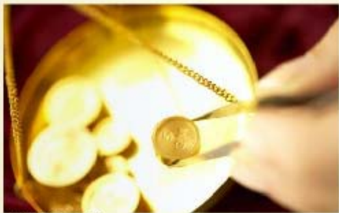
中国黄金需求增长

中国大陆的投资者和消费者在香港购买黄金的热情持续升温，并在去年年底前创下历史新高。