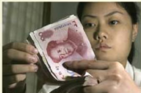
中国的银行职员在清点人民币

中国经济增长的步伐继续放缓，2011年第四季度GDP增幅下降到8.9%，导致全年经济增长从2010年的10.4%回落到2011年的9.2%。专家预计，2012年，中国经济将进一步放慢脚步。