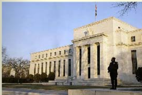
图为位于美国首都华盛顿的美联储2010年资料照

美联储刚刚公布的2006年会议记录显示，联储官员5年前对于当年晚些时候爆发的次贷危机和之后席卷全球的全融危机毫无思想准备。