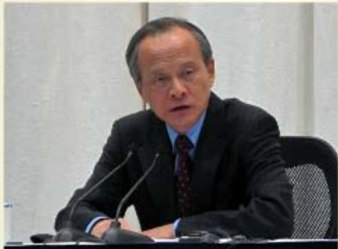
中国外交部副部长崔天凯

中国一名高级外交官员星期一拒绝将贸易与伊朗的核项目问题挂钩。他是在美国财政部长盖特纳访华，以寻求中国支持对伊朗石油企业实施制裁之前作出上述表示的。