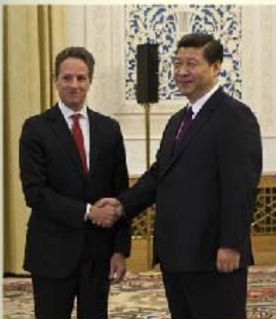
中国副主席习近平(右)11日在北京会见到访的美国财政部长盖特纳

美国财政部长盖特纳正在寻求中国支持美国对伊朗施行的新制裁。中国政府说，对有关伊朗正在研制可用于制造武器的浓缩铀的报道，中国表示关注。不过，中国坚持自己的立场，那就是要对话不要制裁，这才是解决问题的办法。