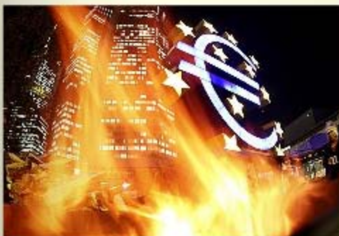
位于德国法兰克福的欧洲中央银行2011年11月21日

欧洲领导人星期六对标准普尔公司(S&P)下调9个欧洲国家信用评级的举动进行回击，称这一举动是没有根据和不符合标准的。