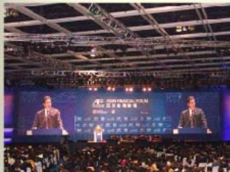
英國財政大臣奧斯本在香港亞洲金融論壇上演講

英國財政大臣奧斯本星期一（1月16日）在香港舉行的亞洲金融論壇上說，倫敦將努力打造成一個新的人民幣國際交易中心。但外間分析認為，基於中國在人民幣問題上的漸進政策，倫敦搶占人民幣市場雖然是一個積極的動作，但短期內恐難有大收獲。